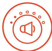
Nível Baixo de Ruído