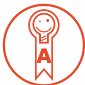
Selo Procel A