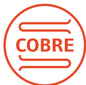
Serpentina de Cobre