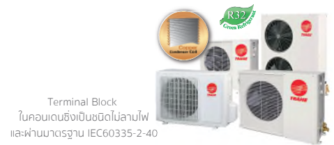
Terminal Block ในคอมเดนซิ่งเป็นชนิดไม่ลามไฟ และผ่านมาตรฐาน IEC60335-2-40

พร้อมด้วย Condensing Unit ที่มีมาตรฐานการทำงานสูง รับประกันคุณภาพคอมเพรสเซอร์ นานถึง 7 ปี