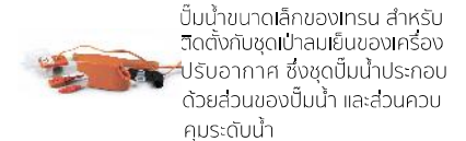
(เหมาะสำหรับเครื่องปรับอากาศขนาด 1-5 ตัน)

*ควรคำนวณปริมาณการไหลของน้ำทิ้งตามระยะที่จุดและที่ติดตั้งตามเป็นจริง (อ้างอิงคู่มือการใช้งาน เพื่อการใช้งานที่เหมาะสม)