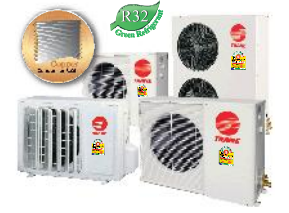
Terminal Block ในคอนเดนซึ่งเป็นชนิดไม่สายไฟ และผ่านมาตรฐาน IEC60335-2-40