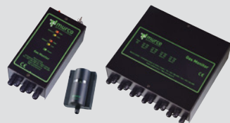
Стандартный модуль контроля

Оба модуля контроля могут подсоединяться к системе Trane диспетчеризации инженерного оборудования здания.