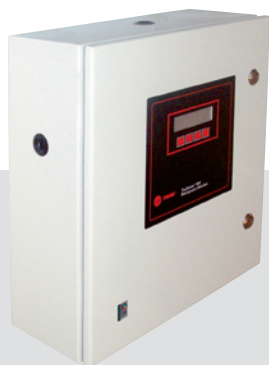
Высококачественный модуль контроля