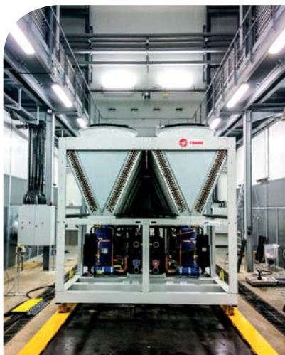
CMAC HE-Gerät in einem Test in unserem Labor in Charmes (F)

Planen Sie einen optionalen Test in Ihrer Anwesenheit in der Testeinrichtung in Frankreich, bevor das Gerät zum Aufstellen versendet wird. Die Testeinrichtung von Trane kann die Leistung Ihrer Mehrleiternmaschine überprüfen – auf Grundlage von kundenspezifischen Parametern. Informationen erhalten Sie von Ihrem örtlichen Verkaufsbüro.