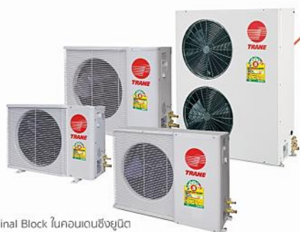
Terminal Block ในคอนเดนซิ่งยูนิต เป็นชนิดไม่ลามไฟ และผ่านมาตรฐาน IEC60335-2-40