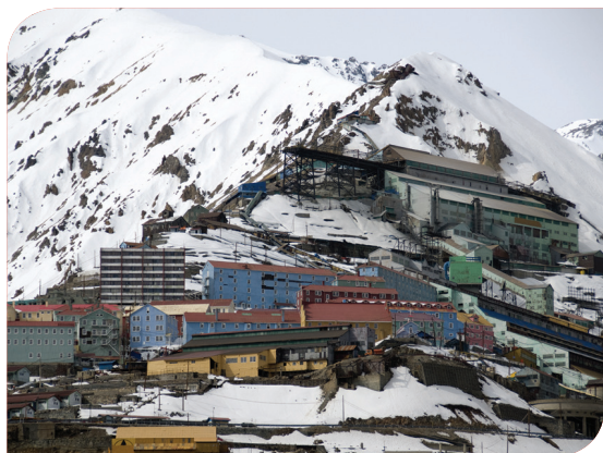
CODELCO (Santiago, Chile)

RTAC trabaja con sistemas de almacenamiento térmico de bajo consumo de energía, haciendo hielo durante la noche, cuando las empresas proveedoras de energía cobran menos por el suministro de la misma. El tanque de hielo complementa, e incluso puede reemplazar, el enfriamiento mecánico durante las horas del día cuando las tarifas de energía son más altas. Además, RTAC, muchas veces, puede fabricar hielo con el mismo rendimiento (o mejor) que el de producir agua a 6,5°C (44°F) durante el día. Eso se debe a las temperaturas ambiente reducidas durante la noche, cuando se produce el hielo.