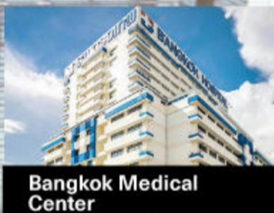
Bangkok Medical Center

The Sappaya-Sapasathan is the latest parliament house building. It is a large parliament house building project on an area of over 424,000 square meters, can accommodate more than 5,000 people.