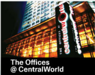
The Offices @ CentralWorld

Central Pattana Public Co., Ltd. or CPN uses Trane High Efficiency Chillers in their many building complexes that can reduce total HVAC energy consumption up to 16 percent. This is contributed to reduction of carbon dioxide emissions into the atmosphere more than 40,000 tons per year. The Offices @ CentralWorld is their energy-saving prototype building. In 2008, they can save energy 1,459,200 KWh per year or they can decrease carbon dioxide emissions into the atmosphere more than 1,000 tons per year.